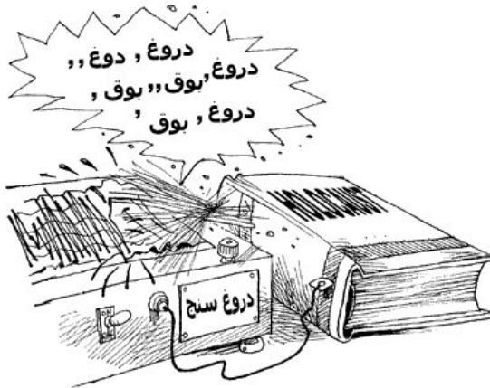
دروغ سنج برای هولوکاست اثرسید مسعود شجاعی طباطبایی

امید مهدی‌نژاد در مقدمه کتابی تحت عنوان هولوکاست که بخشی از کارتون‌های هولوکاست را منتشر کرده می‌نویسد : "در این کتاب تلاش شده است تا دروغ آشکار «گشته شدن برنامهریزی شده شش میلیون یهودی در جنگ جهانی دوم»، موسوم به «هولوکاست» به نقد کشیده شود. دروغی که امروز آنقدر آشکار است که نیازی به توضیح مجدد از جانب هیچکس ندارد. دروغی که صهیونیست‌های اشغالگر فلسطین، با اتکاء بر آن، سالهاست اشغال فلسطین و جنایاتی را که از آن زمان تا کنون در این سرزمین انجام داده‌اند، توجیه می‌کنند." دوم آن که تبری جستن مقامات وزارت خارجه از این مسابقات در دوران دولت روحانی دقیقاً بر خلاف سخن اعلام شده است. اگر این مسابقه و نمایشگاه آن نافی هولوکاست نیست چرا محمد جواد ظریف از آن تبری می‌جوید؟ و سوم آن که وقتی دیگر سخنان دبیر این مسابقه را لحاظ کنیم مشخص می‌شود که ادعاهای وی چندان پایه و اساسی ندارد.