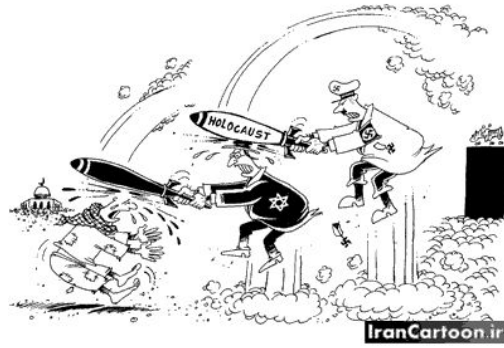
(4) توجیه موجودیت اسرائیل با هولوکاست،