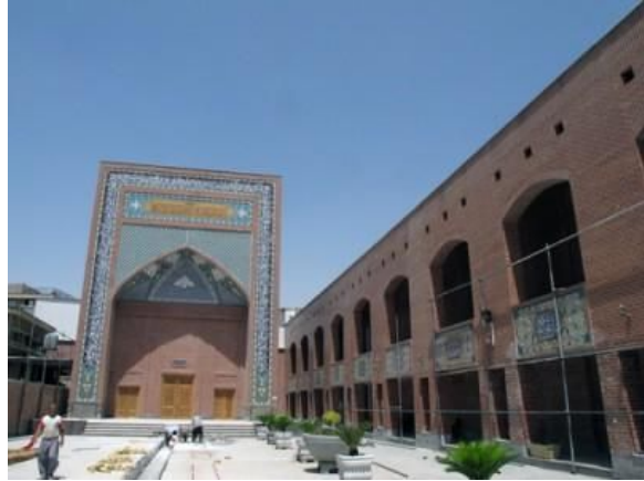
موسسه‌ی فرهنگی شهدای انقلاب اسلامی (سرچشمه)

نمایشگاه‌های دوسالانه‌ی کاریکاتور که قرار است دوره‌ی جدید آن به موضوع هولوکاست اختصاص یابد اصولاً یک نمایشگاه دولتی است و هزینه‌های آن از سوی وزارت ارشاد تأمین می‌شود. اصولاً در ایران هیچ مسابقه و نمایشگاهی بدون مجوز وزارت ارشاد قابل برگزار شدن نیست. برگزارکنندگان این مسابقات و نمایشگاه‌ها آن قدر قدرتمند هستند که وزارت ارشاد نمی‌تواند از دادن مجوز به آنها خودداری کند. محل برگزاری نمایشگاه دوم موزه‌ی فلسطین خواهد بود. موزه‌ی فلسطین هم مانند مرکز صبا بخشی از فرهنگستان هنر جمهوری اسلامی است .