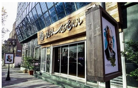
سازمان هنری و رسانه‌ای اوج

رمضان شریف مسئول روابط عمومی سپاه پاسداران درباره نسبت موسسه‌ی اوج با سپاه پاسداران می گوید: "موسسه اوج از همان آغاز جهت گیری معینی را برای فعالیت در حوزه انقلاب، دفاع مقدس و بیداری اسلامی اعلام کرد که هر سه حوزه چسبندگی خاصی با حوزه فعالیت های سپاه پاسداران دارد. از این منظر بدون همکاری تنگاتنگ و حمایت های نهادهایی مانند سپاه و ارتش این فعالیت به ثمر نمی رسد. این موسسه به اعتبار نوع تعریفی که از فعالیت های خود داشته توانسته بیشتر از امکانات حمایتی سپاه بهره مند شود و به این اعتبار اگر در آینده افراد دیگری هم بخواهند فعالیت‌هایی با همین مختصات داشته باشند می توانند از این حمایت ها بهره مند شوند." (مهر 19 آبان 1393) این مسئول سپاه به صراحت از تامین مالی این موسسه توسط سپاه سخن گفته است. موسسه‌ی اوج به روایت خبرگزاری‌ها و سایت‌های خبری داخل کشور پروژه‌های تبلیغاتی سپاه و بسیج را انجام می دهد.