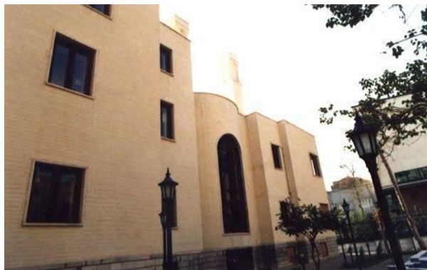
موسسه‌ی فرهنگی هنری صبا

مرکز فرهنگی و هنری صبا که محل نمایشگاه دور اول مسابقه‌ی هولوکاست بود وابسته به فرهنگستان هنر جمهوری اسلامی است که یک موسسه‌ی کاملاً دولتی است و بودجه‌ی آن توسط دولت تامین می‌شود و اعضای آن نیز منصوب مقامات عالی رتبه‌ی نظام هستند.